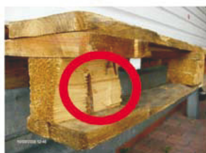
6 Wspornik z odłupaniem ukazującym choćby jeden gwóźdź.