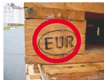
3 Nieprawidłowe oznakowanie na wspornikach.