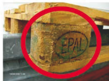
5 Ślady zbutwienia, zagrzybienia bądź próchnicy. Takie palety należy poddać utylizacji.