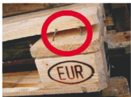
4 Deska górna lub dolna z odłupaniem ukazującym więcej niż 1 gwóźdź.