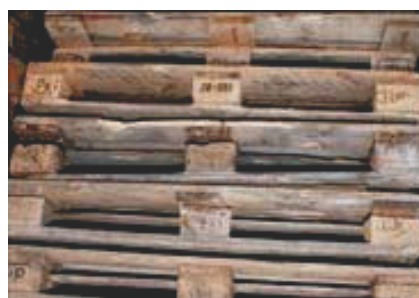
8 Ogólnie zły stan techniczny, np.: trwałe zanieczyszczenie (np. olej, smar, cement), wykorzystanie niedopuszczalnych elementów konstrukcyjnych (desek, wsporników, gwoździ), niewłaściwe pozycjonowanie elementów, np. wspornik przesunięty względem desek.