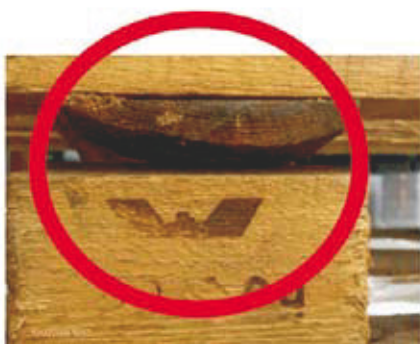
1 Ofis (oblina, odłupanie) wzdłużnic (środkowej i bocznych).