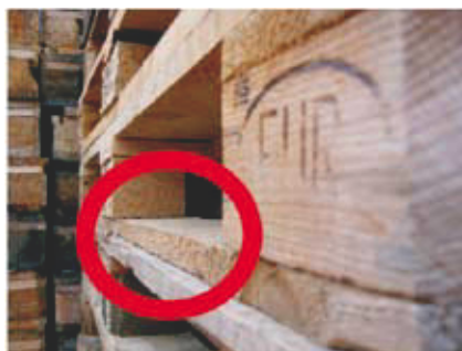
2 Brak frezów na górnych krawędziach desek dolnych lub brak ściąg narożników palety.